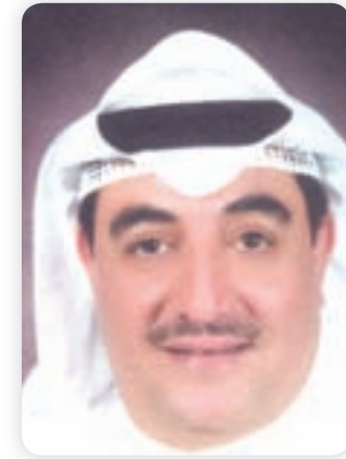
• صادق معرفي

عدم نشر تفاصيل اتفاق الصفقة تضليل المساهمين ويضع البورصة في خانة الانحياز إلى الكبار ضد صغار المساهمين